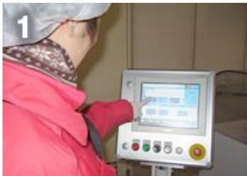
1 メニューより登録してある包装パターンを選択

今回導入した自動包装機は、1時間当たり約1500個の処理能力を有しており、1箱当たりの制限重量は約4キログラム。お客様の取り扱いアイテムに応じて包装仕様(箱の幅、長さ、高さなど)をあらかじめ登録しておくことで、その仕様に合わせて自動的に包装作業が進んでいきます。仕様を変更するたびに、作業員が機械を微調整する必要がないため、機械のアイドルタイムが少なく、作業生産性が高くなるという特徴があります。また、糊づけも、機械が糊を薄く噴霧する構造になっているため、貼り付け部分の凹凸が少なく、綺麗な包装に仕上がります。